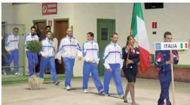
L'ingresso della squadra italiana alla cerimonia d'apertura

In questi giorni, la Savigliano sportiva è in festa: presso il bocciodromo di viale Gozzano sono in corso i campionati europei di bocce, specialità "volo", che vedono sfidarsi i migliori giocatori del continente. Nel fine settimana ci saranno le finalissime, mentre giovedì sera saranno testate ufficialmente le bocce con cui questo sport farà il suo esordio alle Olimpiadi.