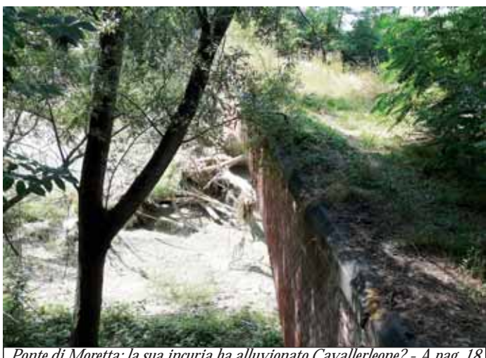
Ponte di Moretta: la sua incuria ha alluvionato Cavallerleone? - A pag. 18