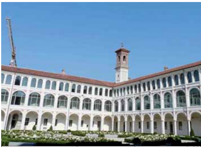
La sede universitaria saviglianese, in via Garibaldi

Durante il Consiglio comunale di giovedì scorso, a sorpresa, si è riaperto lo scontro tra maggioranza ed opposizione. Pomo della discordia: il via libera dell'aula alla convenzione decennale che stabilisce costi e funzionamento della nuova sede universitaria. Obiettivo: ottenere l'unanimità su un tema molto importante per la città. Ma la minoranza accusa: «Ci hanno dato i documenti troppo tardi, come facciamo a farci un'idea?».