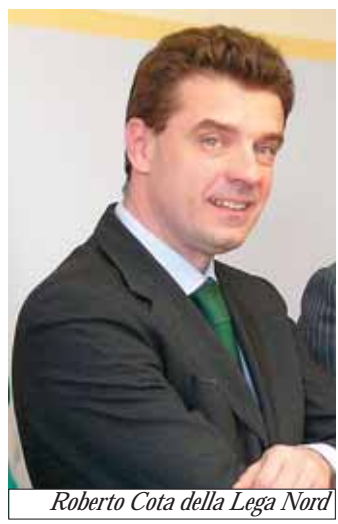
Roberto Cota della Lega Nord

A sfidare Mercedes Bresso alle prossime elezioni regionali sarà il capogruppo leghista alla Camera, il novarese Roberto Cota. La notizia era nell'aria da settimane, ma ancora qualche giorno fa, in visita a Savigliano, il diretto interessato aveva "glissato". Il centrodestra, dunque, punta su un uomo del Carroccio: decisione non proprio condivisa da tutti, a sentire i pareri dei simpatizzanti di Silvio, radunatisi sabato scorso sotto l'Ala. A sinistra, alleanza Pd-Udc? Servizio a pagina 20