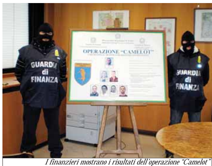
I finanzieri mostrano i risultati dell'operazione "Camelot"

C'è una "neve" che è presente tutto l'anno ed invece di scendere sale. È la cocaina, che dalla Campania saliva verso il Nord. Destinazioni: Brescia e Savigliano. Questo traffico, i cui profitti andavano direttamente nelle casse della camorra, è stato fermato nei giorni scorsi dalla Guardia di Finanza, che ha effettuato una vasta operazione ed ha arrestato ben ventuno persone. Tra queste, un fantomatico "re Artù" che domina sulla nostra città... Servizio a pagina 3