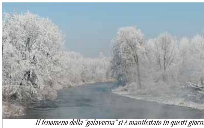
Il fenomeno della "galaverna" si è manifestato in questi giorni

Quella che ci mettiamo alle spalle è stata la settimana più fredda dell'inverno. Le temperature sono scese parecchio: si sono registrati picchi sui meno quindici gradi, anche se c'è chi giura di aver visto colonnine di mercurio segnare ben meno diciotto! Si è manifestato il gradevole effetto scenico della galaverna, che ha reso il paesaggio poetico. Ma poi è arrivata la neve, con i suoi disagi, e di poetico è rimasto ben poco. Sulle strade ghiacciate ci sono stati molti incidenti, di cui uno fatale, a Racconigi. Con la neve, sono fioccate anche le polemiche in Consiglio comunale a Savigliano: secondo l'opposizione, i mezzi spargisale e spartineve partono sempre in ritardo... Servizi alle pagine 7 e 28