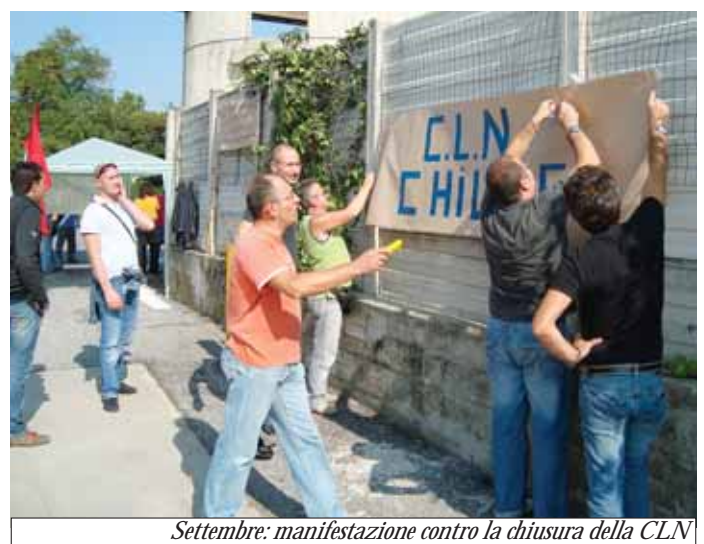
Settembre: manifestazione contro la chiusura della CLN