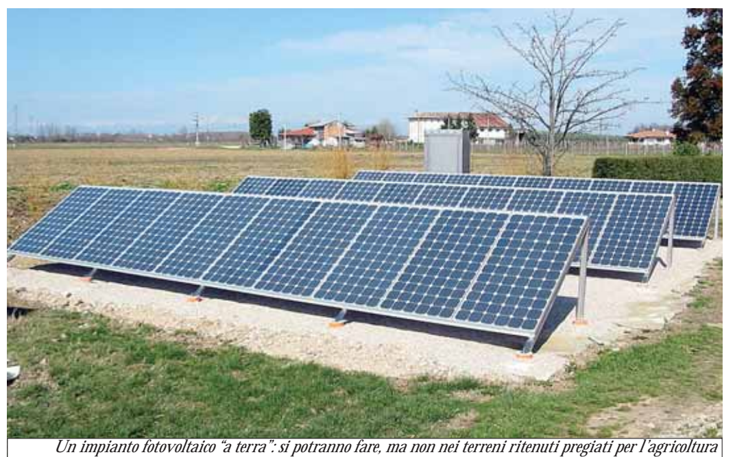
Un impianto fotovoltaico "a terra": si potranno fare, ma non nei terreni ritenuti pregiati per l'agricoltura

Savigliano Buoni risultati nella raccolta differenziata Servizio a pagina 2