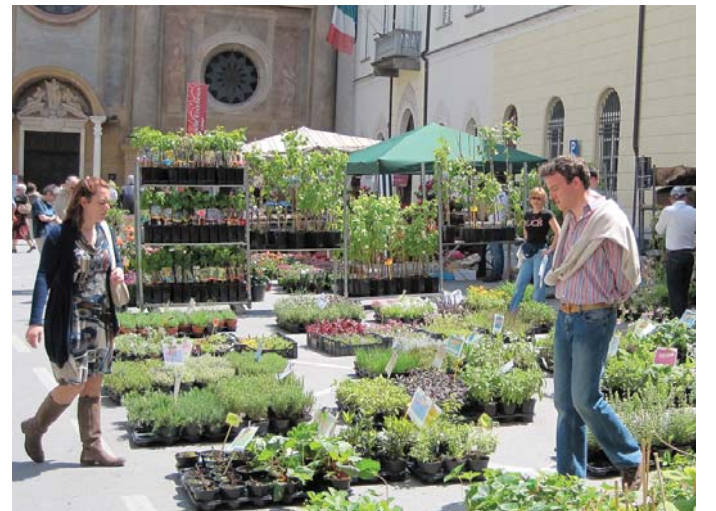
QuintEssenza è giunta alla sua quindicesima edizione