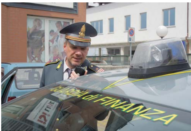
L'operazione è stata effettuata dalla Finanza - A pagina 6