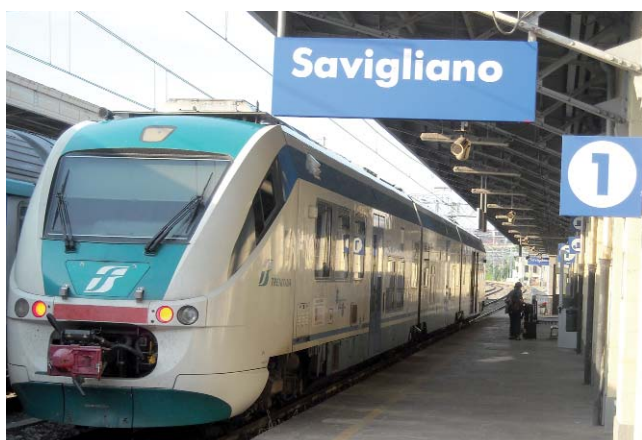
Il nostro viaggio sulla linea Savigliano-Saluzzo A pagina 2