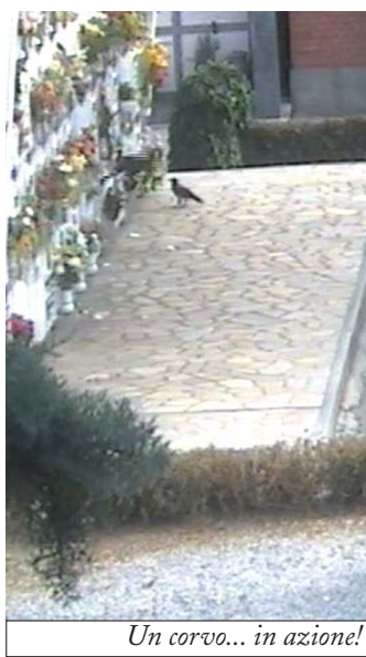
Un corvo... in azione!

sono stati individuati i responsabili. Giovani? Anziani? Il movente? State tranquilli, il colpevole, anzi i colpevoli erano due corvi. Sì, proprio due volatili neri, come hanno testimoniato le riprese effettuate dalla videosorveglianza comunale. Sono loro gli autori degli spiacevoli episodi accaduti all'interno del camposanto. Un "giallo", quindi, che ha dell'incredibile, così come sarebbe stato impensabile arrivare, senza filmati, ai due autori. Che, tra l'altro, non sono stati ancora trovati col il becco tra i fiori. L'Ufficio tecnico è già stato avvisato e dovrà trovare un modo per scacciare i due corvi. Sperando che, nel frattempo, non facciano altri danni.