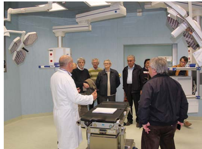
Da lunedì sono in funzione le nuove sale operatorie

sti cinque locali si considera completa l'Area emergenze, che comprende Centro trasfusionale, Laboratorio analisi con Centro prelievi, Pronto soccorso, Rianimazione, Blocco operatorio. Visto che per la realizzazione dell'opera ci sono voluti vent'anni, sul costo, finora, nessuno dai "piani alti" dell'azienda sanitaria aveva azzardato delle cifre. Ma finalmente in una nota si legge: "Tutta l'area, comprese anche la palazzina uffici esterna e il generatore, ha un costo di circa 12 milioni di euro. Le sole sale operatorie costano all'incirca la metà".